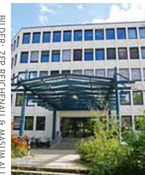
STAND FEBRUAR 2023

Akademisches Lehrkrankenhaus der Universität Konstanz