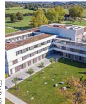
STAND APRIL 2023